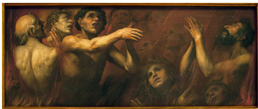
Dusze czyścicowe. Obraz Alonso Cano (1601-1667), olej na płótnie

Każdy czyn pociąga za sobą konsekwencje. Podczas spowiedzi świętej Pan Bóg odpuszcza nam winę za grzechy, ale pozostaje jeszcze kara za skutki tych grzechów. Może zostać zgładzona przez trudy życia, cierpienie w czyśćcu lub... odpusty!