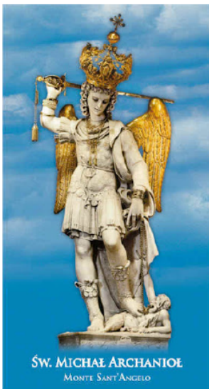
ŚW. MICHAŁ ARCHANIOŁ MONTE SANT'ANGELO

Sanktuarium w Monte Sant'Angelo, wzniesione na cześć Świętego Michała, jest jednym z najstarszych i najbardziej znaczących miejsc kultu tego Archanioła. Założone w miejscu jednego z objawień na Górze Gargano, sanktuarium stało się symbolem duchowej mocy i opieki, jaką Michał oferuje wiernym. Zawiera liczne dzieła sztuki związane z kultem Archanioła, a Jego bogata historia odzwierciedla głęboki wpływ, jaki kult Michała wywarł na rozwój duchowy i kulturalny regionu. Sanktuarium, będące bazyliką, jest miejscem, gdzie wierni zgromadzają się na modlitwie, prosząc