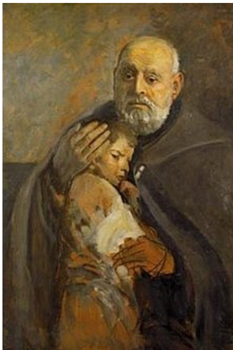
Adam Hilary Bernard Chmielowski, znany jako święty Albert Chmielowski oraz święty Brat Albert (ur. 20 sierpnia 1845- Igołomia zm. 25 grudnia 1916, Kraków)

" BYŁ DOBRY JAK CHLEB" - tak o Bracie Albecie mówili wszyscy, którzy go znali. Najpierw za dzielność i odwagę, kiedy walczył w Powstaniu Styczniowym o wolność naszego kraju (tam stracił nogę), później za jego piękne obrazy i za miłość do bliźniego, za serce jakie okazywał każdemu potrzebującemu. Bardzo kochał rodziców, ponieważ to oni nauczili go miłości do Boga i Ojczyzny i to oni rozwijali w nim pasję malowania. Był wspaniałym malarzem, a jego obrazy uznawane były za bardzo piękne. Chłopiec pokochał jednak Pana Jezusa i kiedy namalował Jego twarz w koronie cierniowej, nagle zobaczył w niej biednych, chorych, głodnych i potrzebujących. Klęczał przed tym obrazem kilka dni i nocy i żarliwie się modlił. Wstał potem, wyszedł do miasta i kupił tyle chleba ile zdołał, potem zaprosił do siebie wszystkich potrzebujących. Odtąd jego pracownia malarska stała się przytułkiem dla bezdomnych. Brat Albert poświęcił się wyłącznie biednym. Zakładał dla nich domy opieki i zdobywał dla nich jedzenie i odzież. Dzielił się z nimi każdym okruszkiem chleba, a oni zawsze ufnie wyciągali do niego ręce po chleb.