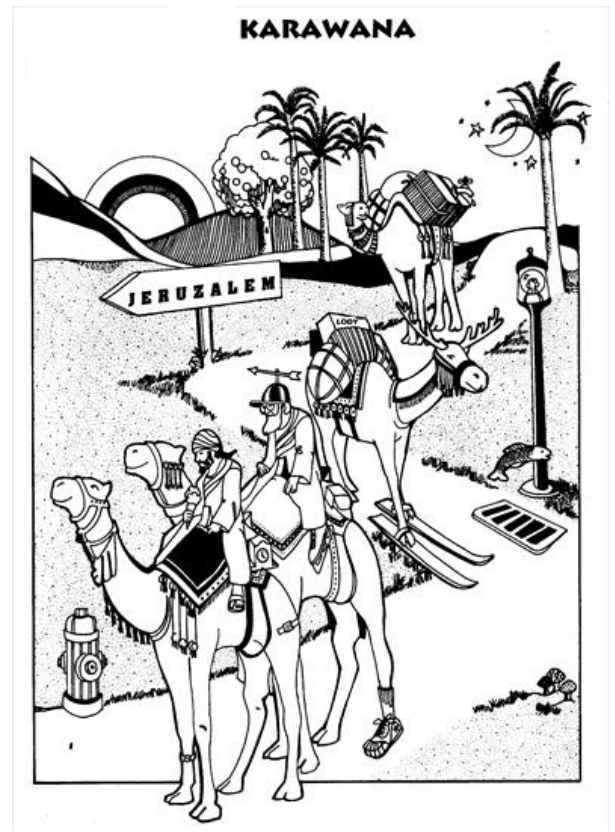
Ile przedmiotów nie pasuje do tego obrazka?

-Pewnie, że tak. A tak naprawdę, to osoby, które nie mają swych świętych patronów, wybierają sobie na bierzmowaniu świętego i to właśnie jego mogą prosić o pomoc.