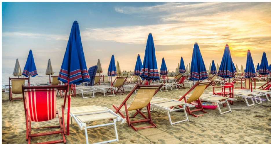
Październik na plaży nad Morzem Czarnym.

Śniadanie. Wczesny wyjazd z hotelu. Przejazd na południe kraju. Po południu Vardzia – malowniczy kompleks skalnego miasta, niegdyś 13 – piętrowego, zbudowanego w XII wieku, za czasów królowej Tamary. Kompleks składał się