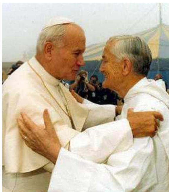
Brat Roger. Promieniował świętością Chrystusa